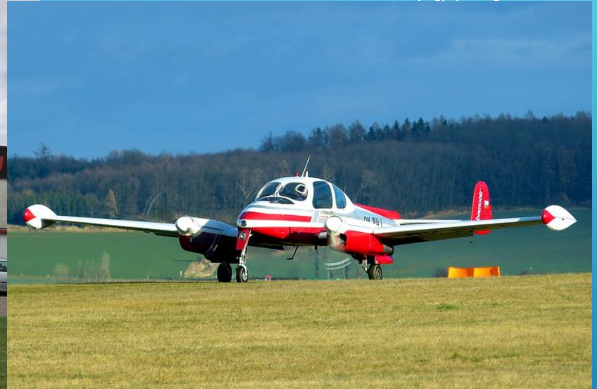
Fotografie z události č.1 :