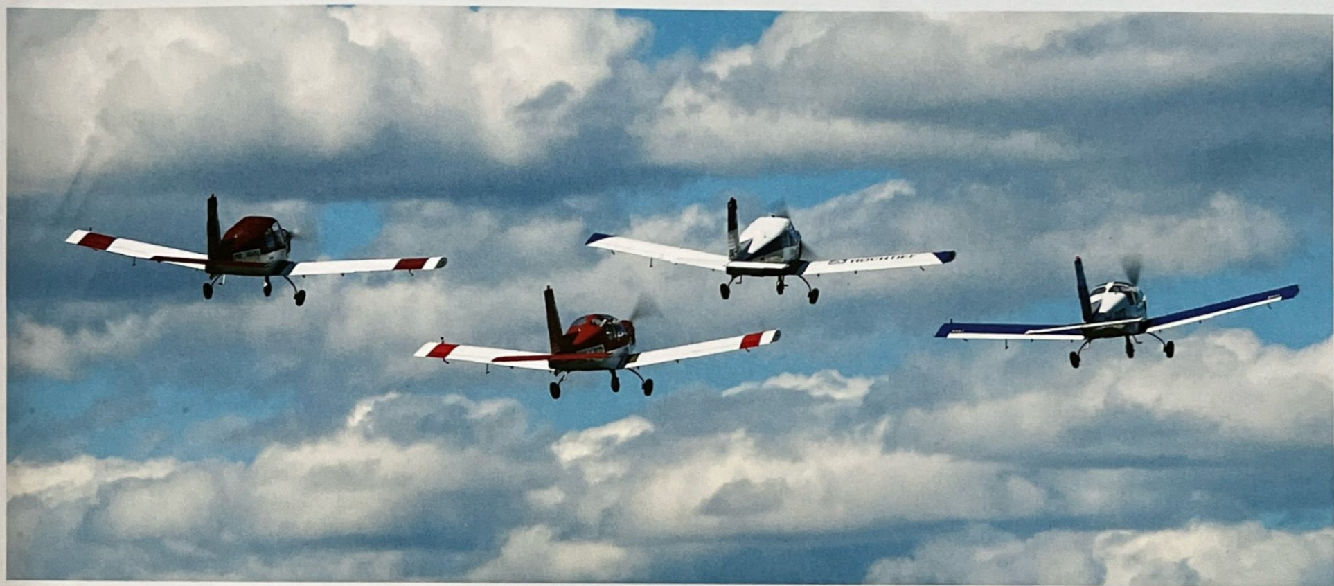
• Obnovený Bemobox při jednom z vystoupení v roce 2023

Prezentovali jsme naše postupně vypilované umění na leteckých dnech většinou na domácím letišti v Benešově, ale v roce 2000 a 2002 i na nově vzniklém pražském výstavišti v Letňanech při příležitosti výstavy a veletrhu Letadla a létání. Poté však nastal klid skupiny,