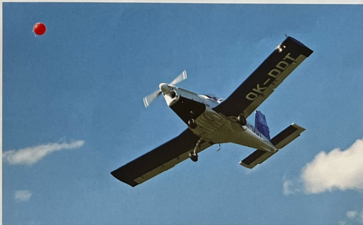
• Srážení balonků je sice divácky velmi atraktivní, ale pro piloty nijak jednoduchá disciplína